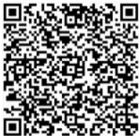
食品安全培训二维码